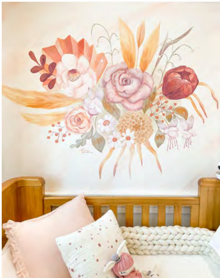
Serenate – private collection – Brazil, 2021 Pittura murale acrilica su parete / 100cm H x 150cm L