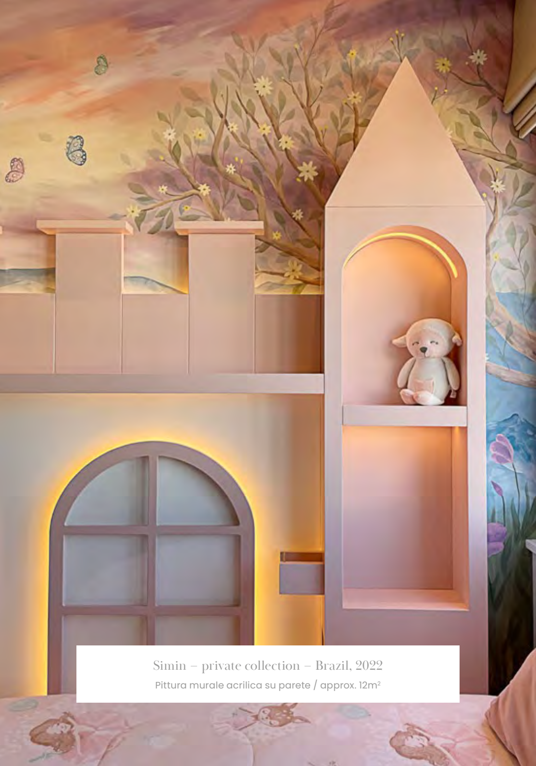
Simin – private collection – Brazil, 2022 Pittura murale acrilica su parete / approx. 12m 2