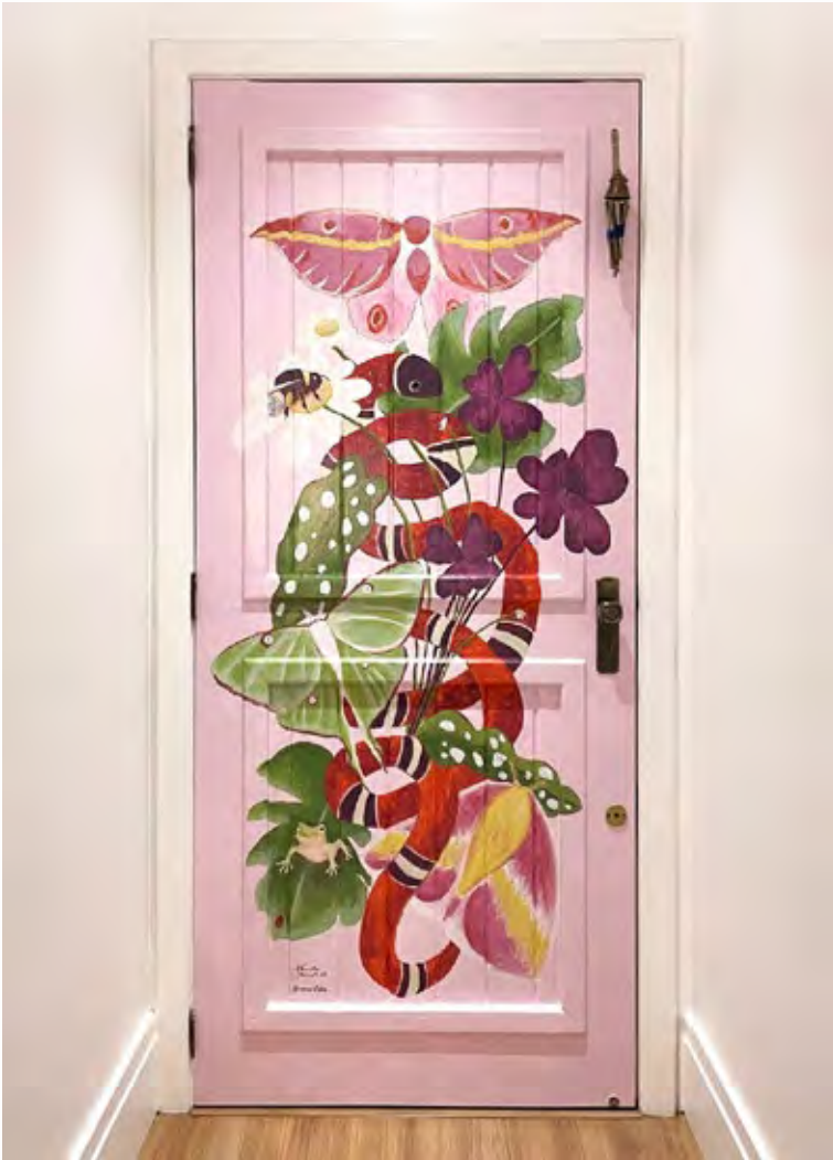
Pachamama – private collection – Brazil, 2021

Pittura murale acrilica su parete / 200cm H x 90cm L