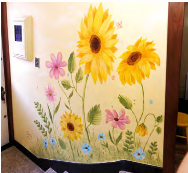
Sunflower – private collection – Brazil, 2020 Pittura murale acrilica su parete / 250cm H x 200cm L