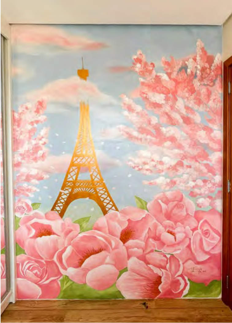
Olson sisters – Brazil, 2021

Pittura murale acrilica su parete / 300cm H x 200cm L